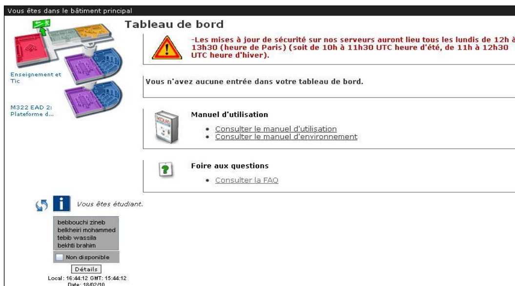
Figure 1 : tableau de bord de la plateforme Univ-Rct

L'interface utilisateur, est extrêmement simple à prendre en main. La plateforme Univ-R CT ordonnance des lieux virtuels de formation en leur assignant des fonctions, des outils et en repensant les relations entre utilisateurs. Cette architecture anticipe ainsi les modes relationnels qui se nouent dans un environnement virtuel.